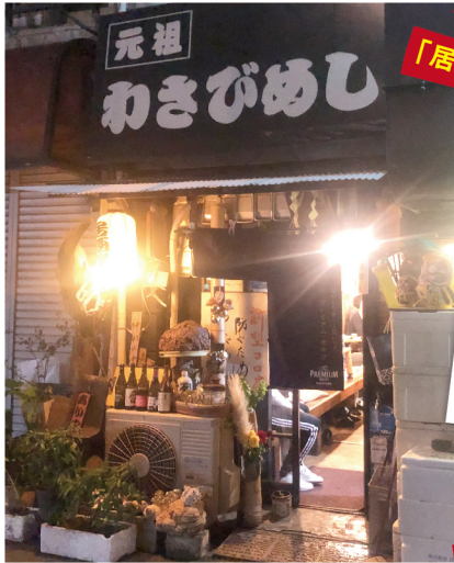
【お店情報】 東京都新宿区市谷柳町8 ☎ 03-3268-6467 ① 17:00~23:00(日曜定休)